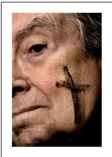
Antoni Tàpies, artista. Barcelona, 2009