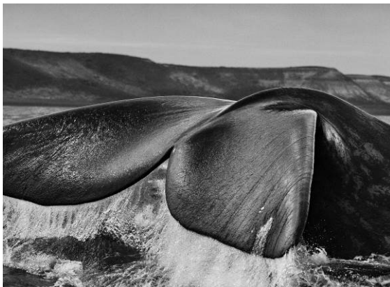
Les balenes franques australs ( Eubalaena australis ), atretes a la península Valdés pel recer que brinden els seus dos golfs, el de San José i el Nuevo, acostumen a nedar amb la cua dreta i fora de l'aigua. Península Valdés. Argentina. 2004.

L'exposició, comissariada per Lélia Wanick Salgado, està formada per 38 fotografies en un èpic blanc i negre que són el testimoni d'una llarga coexistència dels humans amb la naturalesa, i una oda visual a un món que hem de protegir.