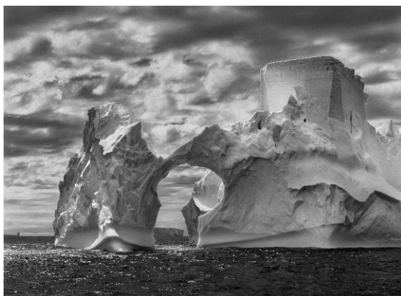
Iceberg entre l'illa Paulet i les illes Shetland del Sud, al mar de Weddell. Prop de la superfície, els nivells de flotació anteriors són clarament visibles en el glaç, que el moviment constant de l'oceà ha anat polint. Dalt de tot, una forma semblant a la torre d'un castell ha estat tallada per l'erosió eòlica i les peces adossades de glaç. Península Antàrtica. Gener i febrer del 2005.

A finals del 1990, després de fotografiar durant unes quantes dècades arreu del món les grans transformacions demogràfiques i culturals del nostre temps, Sebastião Salgado va tornar al seu lloc natal, una finca ramadera a la vall del riu Doce, a l'estat de Minas Gerais, al Brasil. Les terres abans fèrtils, envoltades de vegetació tropical, amb una exuberant diversitat d'espècies vegetals i animals, havien estat víctimes d'un procés de desforestació i erosió. La naturalesa semblava esgotada. La seva dona, Lélia Wanick Salgado, va tenir la idea de replantar un bosc amb les mateixes espècies autòctones, recreant l'ecosistema que Salgado havia conegut de nen. A poc a poc els animals van anar tornant, fins que es va aconseguir un renaixement complet de la zona. Actualment la finca és un espai protegit.