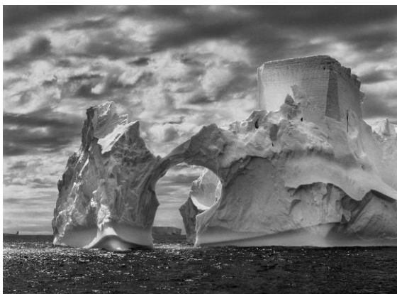
Iceberg entre l'illa Paulet i les illes Shetland del Sud, al mar de Weddell. Prop de la superfície, els nivells de flotació anteriors són clarament visibles en el glaç, que el moviment constant de l'oceà ha anat polint. Dalt de tot, una forma semblant a la torre d'un castell ha estat tallada per l'erosió eòlica i les peces adossades de glaç. Península Antàrtica. Gener i febrer del 2005.