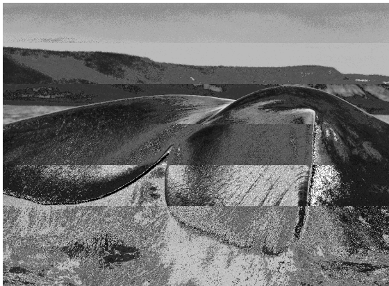
Les balenes franques australs ( Eubalaena australis ), atretes a la península Valdés pel recer que brinden els seus dos golfs, el de San José i el Nuevo, acostumen a nedar amb la cua dreta i fora de l'aigua. Península Valdés. Argentina. 2004.

L'exposició, comissariada per Lélia Wanick Salgado, està formada per 38 fotografies en un èpic blanc i negre que són el testimoni d'una llarga coexistència dels humans amb la naturalesa, i una oda visual a un món que hem de protegir.