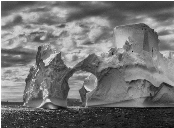
Iceberg entre l'illa Paulet i les illes Shetland del Sud, al mar de Weddell. Prop de la superfície, els nivells de flotació anteriors són clarament visibles en el glaç, que el moviment constant de l'oceà ha anat polint. Dalt de tot, una forma semblant a la torre d'un castell ha estat tallada per l'erosió eòlica i les peces adossades de glaç. Península Antàrtica. Gener i febrer del 2005.

A finals del 1990, després de fotografiar durant unes quantes dècades arreu del món les grans transformacions demogràfiques i culturals del nostre temps, Sebastião Salgado va tornar al seu lloc natal, una finca ramadera a la vall del riu Doce, a l'estat de Minas Gerais, al Brasil. Les terres abans fèrtils, envoltades de vegetació tropical, amb una exuberant diversitat d'espècies vegetals i animals, havien estat víctimes d'un procés de desforestació i erosió. La naturalesa semblava esgotada. La seva dona, Lélia Wanick Salgado, va tenir la idea