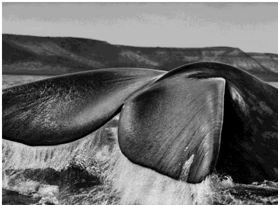
Les balenes franques australs ( Eubalaena australis ), atretes a la península Valdés pel recer que brinden els seus dos golfs, el de San José i el Nuevo, acostumen a nedar amb la cua dreta i fora de l'aigua. Península Valdés. Argentina. 2004.

L'exposició, comissariada per Lélia Wanick Salgado, està formada per 38 fotografies en un èpic blanc i negre que són el testimoni d'una llarga coexistència dels humans amb la naturalesa, i una oda visual a un món que hem de protegir.