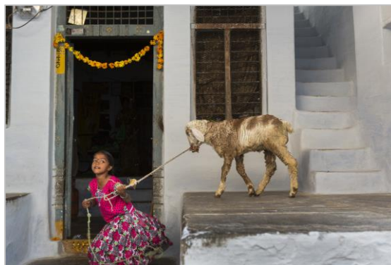
Una nena juga amb un xai a Bukaraya Samudram durant la festivitats del Teru.

La mostra aprofundeix en el més sensible i màgic del món femení, com també en la força i la capacitat de superació de les dones d'Anantapur. La fotògrafa s'hi ha apropat amb un respecte reverencial. Obstinada i desmesurada, García Rodero ha sabut submergir-se en aquest món i fondre's en l'alegria i el patiment de les persones que encobreixen amb color i distinció els claroscurs de la seva pròpia existència.