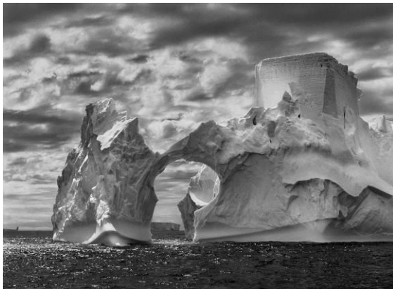
Iceberg entre l'illa Paulet i les illes Shetland del Sud, al mar de Weddell. Prop de la superfície, els nivells de flotació anteriors són clarament visibles en el glaç, que el moviment constant de l'oceà ha anat polint. Dalt de tot, una forma semblant a la torre d'un castell ha estat tallada per l'erosió eòlica i les peces adossades de glaç. Península Antàrtica. Gener i febrer del 2005.