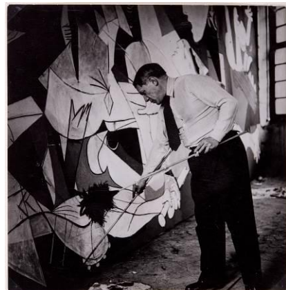
Dora Maar. Picasso dret treballant en el Guernica al seu taller de Grands-Augustins

Els diferents espais i recursos expositius de la mostra descobreixen el context històric de l'època, com també les claus per entendre la